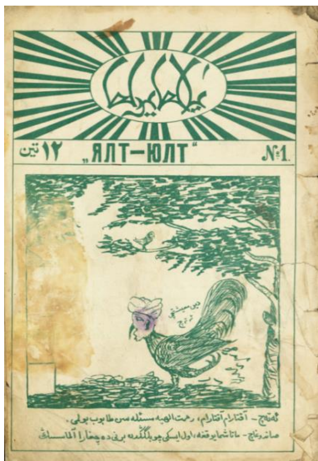
“Ялт – йолт”

Тукай килгәнче Казанда халык әдәбияты, балалар әдәбияты мәсьәләләре беркайчан да проблема итеп күтәрелмәгән була әле. Дәрәс, халык кулында балалар яратып укый торган Каюм Насыри, С.Рахманколий, Таиб Яхин китаплары, аерым хрестоматияләр була. Казанның әдәби көчләре дә инде байтак танылган. Галиәсгар Камал, Фатих Әмирхан, Гафур Коләхмәтовлар инде билгеле талантлар. Казан – университетлы, институтлы, берничә гимназияле, күп сандагы реаль училищелы, мәдрәсәле, бик күп клублы, әллә ничә төрле жәмгыятьле шәһәр. Әллә ничә газета-журнал, әллә ничә басмаханә бар анда. Тукай Казанга килгәч тә, энә шул мәдәният-мәгърифәт атмосферасына чумып, иң кирәкле ике юнәлешне сайлап ала: халык әдәбиятын күтәрү һәм яшь буын өчен әсәрләр, уку китаплары, дәрәслекләр язу. Тукай балалар әдәбиятына һәм халык әдәбиятын өйрәнү, бастырып чыгару эшенә нигез сала. Аның Казандагы кыска гомерендә балалар өчен булган унөч, халык ижаты буенча дүрт, барлығы утыздан артык китабы басылып чыга.