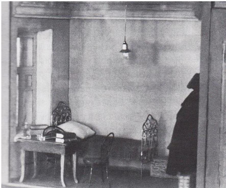
Тукай яшәгән 40 нчы бүлмәнең макеты