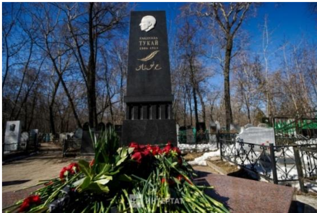
Яңа бистә зиратында Тукай кабере

Казан шәһәренең бүген Островский исеме белән йөртелгән урамындагы больницадан Тукайны Яңа бистә зиратына озаталар.